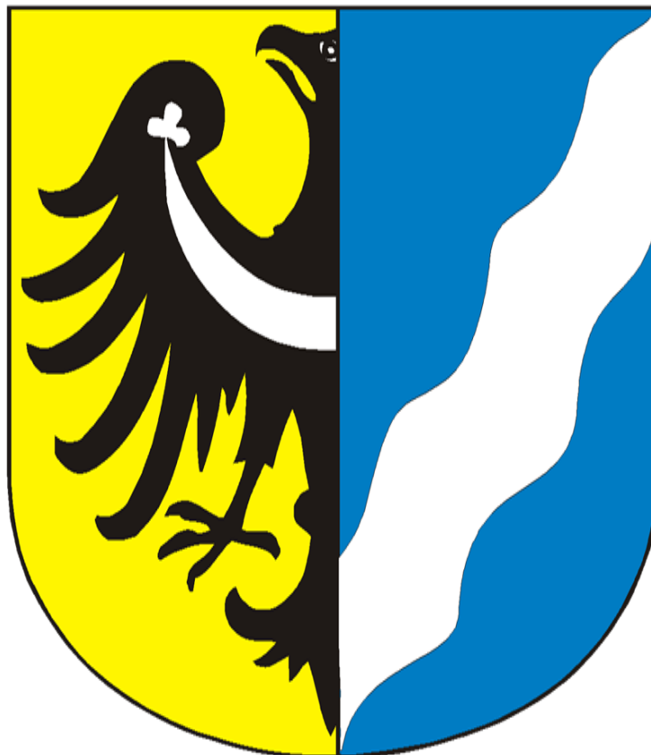
Herb Powiatu Nowosolskiego

ustanowiony uchwałą Nr XXXIV/211/2002 Rady Powiatu Nowosolskiego z dnia 20 lutego 2002 r. w sprawie uchwalenia herbu i flagi Powiatu Nowosolskiego